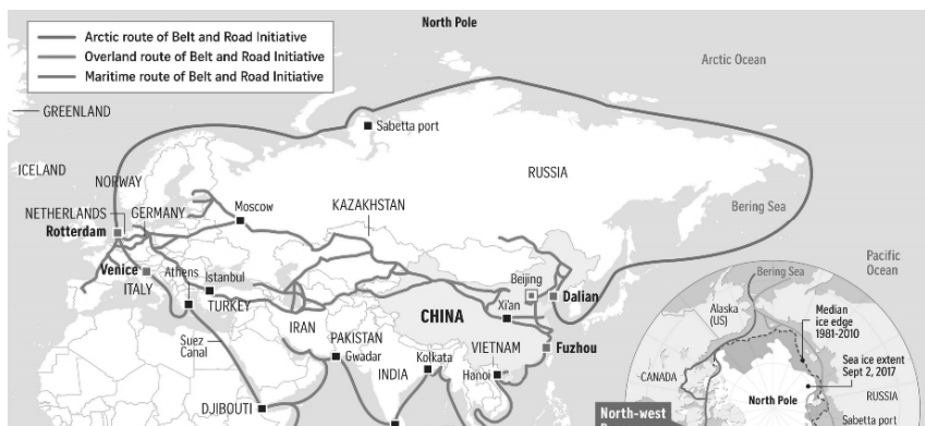
Рис. 3. Маршрут предполагаемого Полярного Шелкового пути.